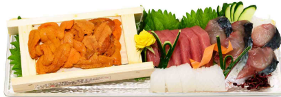
YOHIRA 32-10 クリスタル