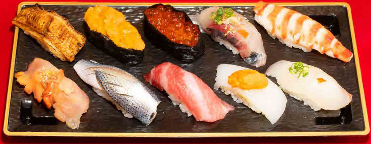
YOHIRA 29-13 フチ金